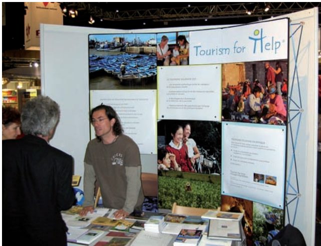
Le stand de Tourism for Help au Salon du livre de Genève

Grâce à l'appui de notre partenaire APN voyages, Tourism for Help a pu assurer une présence au Salon du Livre de Genève du 30 avril au 4 mai 2008. Figurant parmi les exposants du Salon Africain, situé au cœur de la halle, le stand de TfH a permis à notre équipe d'assurer la promotion d'un tourisme solidaire et durable.