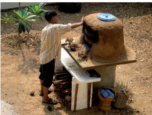
Fabrication de pain au Tonlé dans le four construit par Cyrille Guinut, notre professeur de cuisine, et ses élèves.