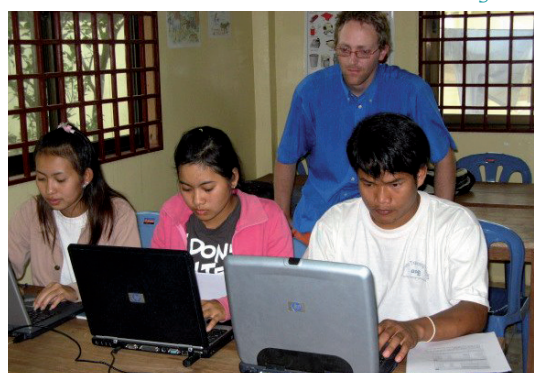
Cours d'informatique au Tonlé