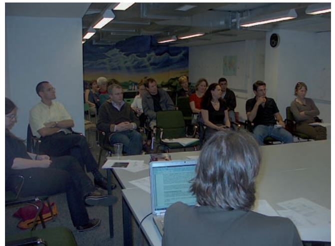
Assemblée générale de Tourism for Help le 29 mai 2008 à la Maison des associations de Genève