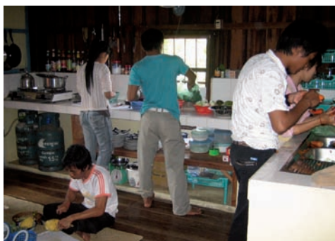
Intense activité dans la cuisine du Tonlé